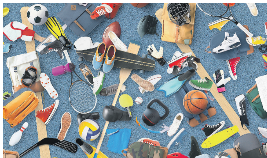
Das Gemeindesportanlagen-Konzept (GESAK) befasst sich mit sämtlichen Sportanlagen und der Bewegungsinfrastruktur Klotens.

Von der gut ausgestatteten Sporthalle und der Joggingstrecke im Wald über ein-