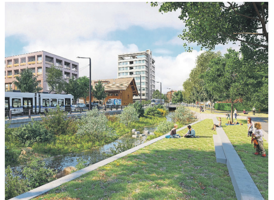
Visualisierung: So wird der zukünftige Stadtpark aussehen. Er stösst direkt mit Sitzstufen an den renaturierten Altbach.